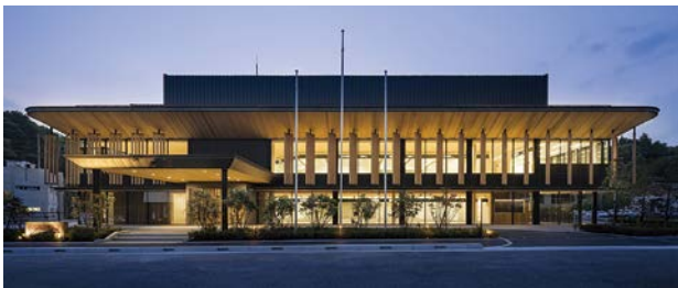
持続的に供給可能な町産材を活用した庁舎外観 夜間は“まちなかり”となる

事務室にはタスクアンビエント照明、エコポイドによる自然通風と自然採光を取り入れ、快適な執務空間を実現した。