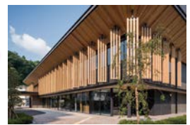
木製ルーバーは町有林の伐期に合わせて更新 『地域システム』の循環を取り入れる

また、様々な災害も想定し、災害時にも機能を維持できる庁舎とし、隣接する公共施設との連携を図り支援等をスムーズに受け入れ可能な施設計画とし、来庁者駐車場は災害時には避難駐車場として利用可能な配置とした。幹線道路沿いに町民利用施設を連続させることにより、町民交流を促す『まちなみ形成ゾーン』と位置付け、整備を行った。