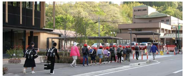
歩道が整備された庁舎前の町道 児童・生徒が安心して登下校できる

この町道沿いは多くの公共施設があるものの、歩道幅員は狭く、福祉施設や病院そして役場への往来に支障をきたす状況であり、通学路として利用する児童・生徒の安全も危惧されていた。今回の改良により、町民が頻繁に利用する施設が整備された歩道で連続し、併せて車道は2車線道路として整備を行った。町道赤谷中央線沿いの施設は車椅子での移動も容易となり、児童・生徒も安心して登下校が可能となり、庁舎建設のテーマの一つであった、『まちなみ形成ゾーン』の一助となった。