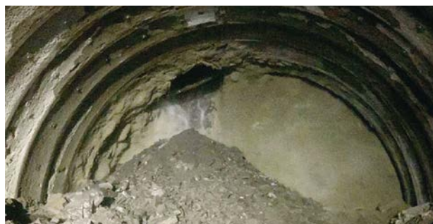
多量湧水・天端崩落の状況

笠波トンネル工事では、終点側坑口からトンネルを掘削したが、約250mの地点に差し掛かった際に、大量の湧水を伴う大規模崩落が発生した。水抜きボーリングや押え盛土などの応急対策を実施し、掘削再開のための空洞部充填や切羽安定のための補助工法の対策を実施した。掘削再開に当たっては変位計測の頻度を増やし、慎重に工事を進めることで無事工事を完成することができた。