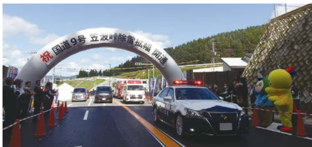
笠波トンネルの開通

笠波峠除雪拡幅事業は、兵庫県の最高峰水ノ山（標高1,510m）に続くハチ北高原の麓に位置する積雪が多い一般国道9号の笠波峠付近において、除雪した雪を積んでおく堆雪帯を設けることで、冬期の安全で円滑な交通を確保するとともに、トンネルにより地すべり区間の回避を目的とした、延長4.6kmの事業である。このうち、笠波トンネル（L=1,744m）を含む延長2.4kmの区間が令和5年10月22日に開通した。