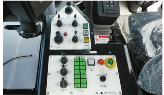
作業装置の操作パネル