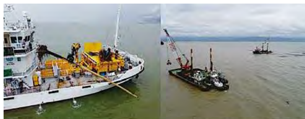
海煌（左）及びクレーン付台船（右）による漂流物回収

令和2年7月豪雨により有明海、八代海に流出した漂流物の回収活動。災害協定団体や漁業者との連携により、7月4日～31日の期間にかけて、令和元年度1年間での回収量の約12倍となる大量の漂流物（15,883m 3 ）を回収したことにより、航行船舶の安全確保及び海洋汚染防汚に大きく寄与した点が評価された。