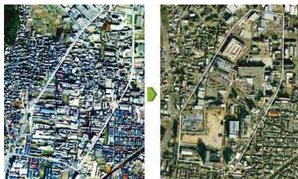
皮革工場の最盛期(昭和58年) 地区の状況(令和2年)

また、公園及び遊歩道の整備におけるシームレスな市民参加は、これまでに計86回のワークショップ、約1,860人の参加に繋がり、市民のアイデアが行政、住民、専門家などを動かし、市民主体のまちづくりの基礎を築いている。