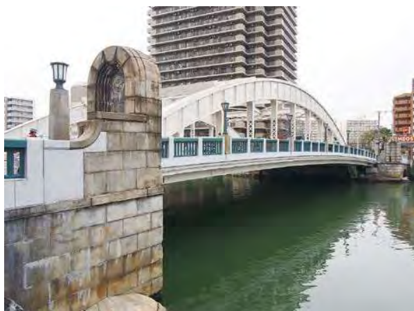
歴史的な景観に配慮した長寿命化対策（改良後）

完成から90年以上が経過した既設下路アーチ橋において、下部工とアーチリブを残しつつ、床組・床版の全面的な取り替えによる対策は前例がなく、歴史的・文化的な特徴を持つ高齢橋梁の長寿命化対策は、全国的にも共通の課題と考えられ、貴重な事例となるものである。