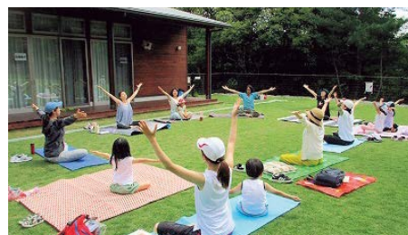
おやこヨガ教室（芝生広場を活用したヨガ体験）

今回の事業によりパークセンターのリニューアル工事とともに子育てコーディネーターを配置し、これまで実施していた大人向けの自然観察会に子どもも参加できるよう内容を変更したり、おやこヨガ教室の開催など「子育て支援プログラム」の拡充を図った。平成29年度から来園者数も右肩上がりに増えており、令和元年度の来園者数は統計を取り始めて以来最高となる110万人を超えた。