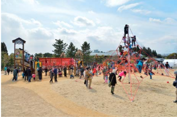
ママも納得！すぎくゆめ広場 カフェからは、遊具で遊ぶ子供の様子が分かる

事業名 うめこうじ 梅小路公園の再整備 授賞機関 京都市建設局みどり政策推進室 実施期間 平成25年度～平成26年度