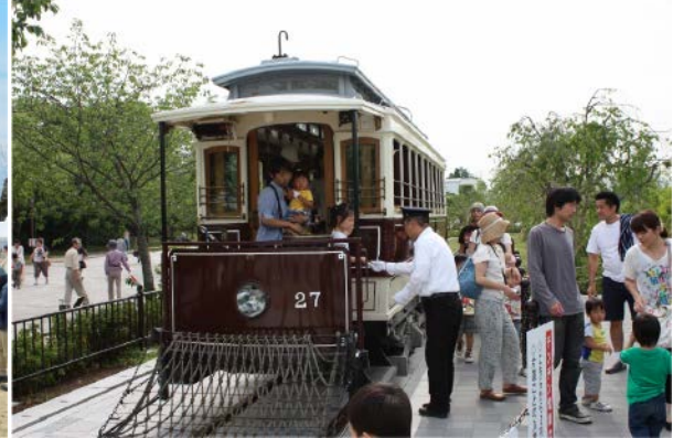
日本最古のチンチン電車 最新鋭の蓄電池車両に改造し、今も、公園内を走る