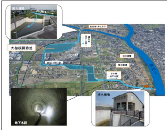
大相模調整池の各施設

事業名 一級河川元荒川 おおさがみ 大相模調節池整備事業 授賞機関 埼玉県越谷県土整備事務所 独立行政法人都市再生機構首都圏ニュータウン本部 実施期間 平成11年度～平成26年度