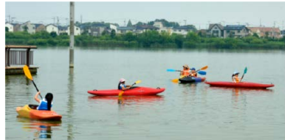
水面を利用 (カヌー)