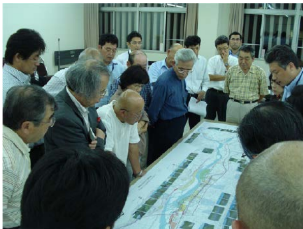
ワークショップ開催状況

事業名 長井地区かわまちづくり 授賞機関 国土交通省東北地方整備局山形河川国道事務所 実施期間 平成21年4月1日～平成27年3月31日