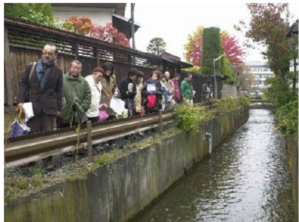
まち歩きコースの設定や通路を整備