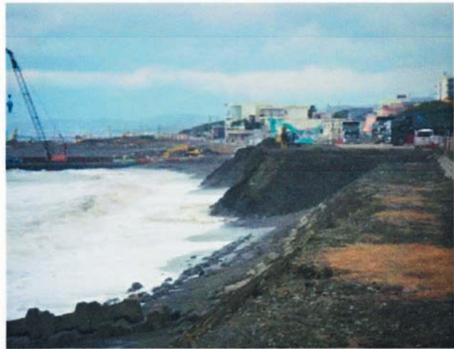
養浜利用状況（茅ヶ崎・中海岸）