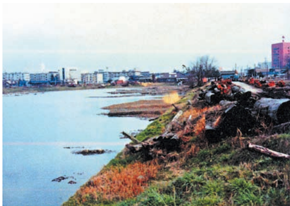
富岩運河舟だまりの写真：昭和63年以前

事業名 歴史ある運河を活かした公園整備（富山県富岩運河環水公園） 受賞機関 富山県 実施期間 平成元年3月6日～平成23年3月27日