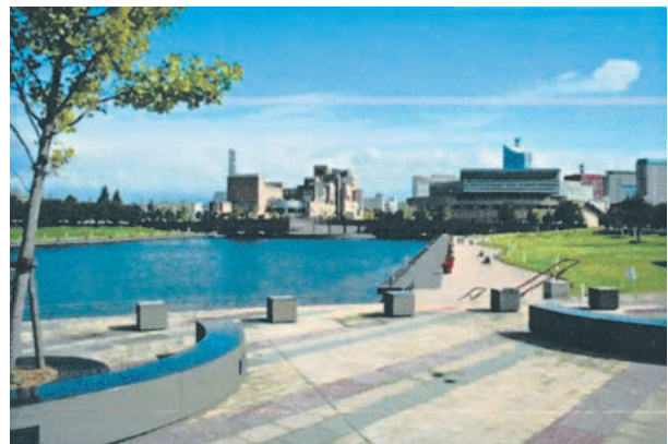
現在：天門橋左岸から富山市総合体育館方向を望む