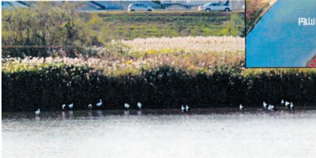
湿地整備箇所に来た 15羽のコウノトリ

事業名 コウノトリ保全の取り組み～高水敷掘削工事による浅瀬（湿地）整備～ 受賞機関 国土交通省近畿地方整備局 豊岡河川国道事務所 実施期間 平成17年10月26日～平成21年3月10日