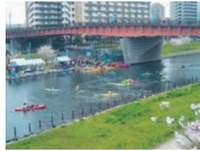
ボート教室 （都内における貴重な水辺利用空間）