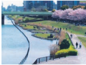
旧中川の花見 （季節感溢れる緑豊かな水辺）