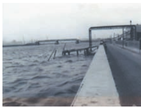
昭和50年代（推移低下前） （天井川となっていた昭和53年以前）

事業名 旧中川整備事業（小名木川排水機場から木下川排水機場区間） 受賞機関 東京都江東治水事務所 実施期間 昭和63年～平成23年3月