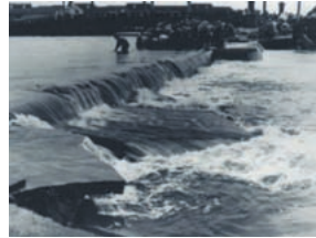
S33年 台風11号 （アリス台風） （住民を苦しめた度重なる水害）