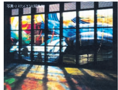
ステンドグラス (昭島側)