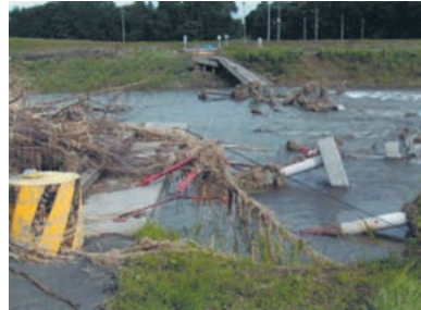
平成14年台風6号による被災状況