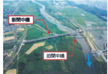
完成した(主)小山環状線間中橋