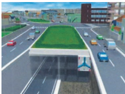
大断面分割シールド工法図

事業名 国道1号原宿交差点立体化事業 受賞機関 国土交通省関東地方整備局 横浜国道事務所 実施期間 昭和62年度～平成22年12月12日