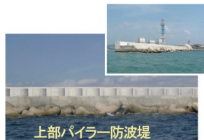
上部パイラー防波堤