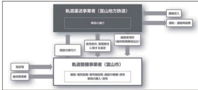
上下分離方式のスキーム

事業名 市内電車環状線化事業 受賞機関 富山市都市整備部路面電車推進室 実施期間 平成20年3月～平成22年3月