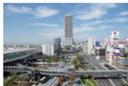
整備後（西側上空から駅前広場を望む）