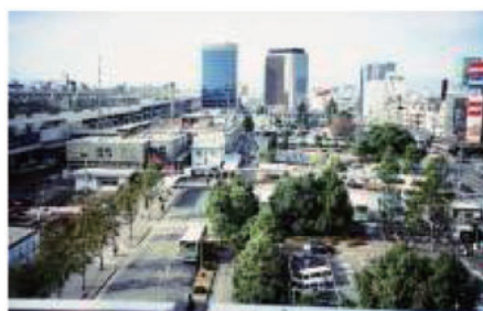
整備前（西側上空から駅前広場を望む）

事業名 岐阜駅北口駅前広場整備事業 受賞機関 岐阜市 実施期間 平成14年度～平成21年度