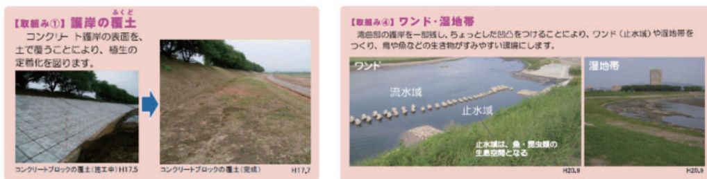
足羽川の自然を守るための取組み

事業名 あすわがわ 足羽川河川激甚災害対策特別緊急事業 受賞機関 福井県足羽川激特対策工事事務所 実施期間 平成16年10月13日～平成22年3月31日