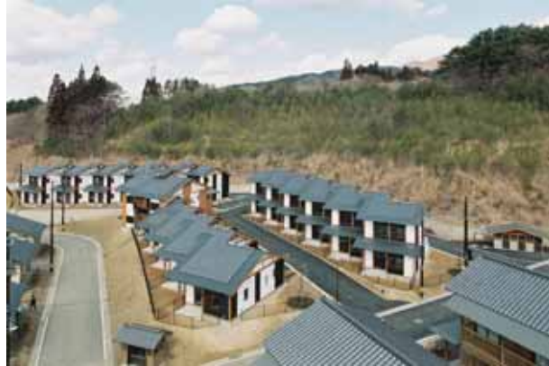
近隣と調和のとれた、統一感のある街並み形成 (手前と左側は、市営住宅)