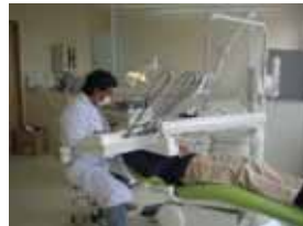
口腔歯科保健センター