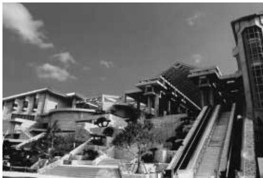
沖縄美ら海水族館

サンゴ礁に囲まれた海岸域の景観に調和し、光と影の織りなす建築デザインとしており、気候風土に根ざした「沖縄らしさ」を演出している。また、斜面という敷地条件を生かして海への眺望を確保しつつ、周辺環境との融合を図っている。また、全長約200mの建築物であるため、展示棟と管理棟の分棟化