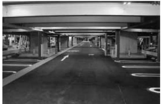
ESAKA - フラッツの1階部分

大阪府から事業費を支出しない独立採算型のPFI事業として成立したことが大きな特徴である。