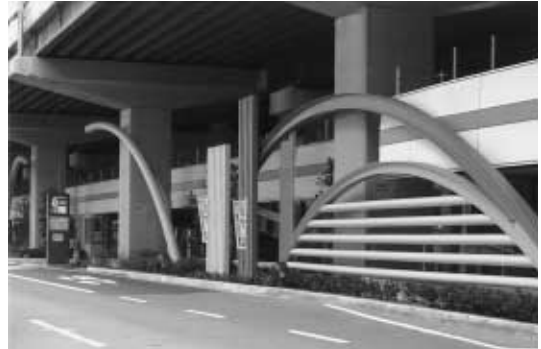
ESAKA - フラッツの外観