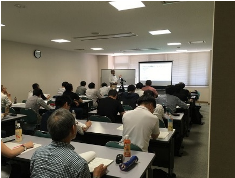
▽午後の、一般部門（総監以外）個別指導の様子