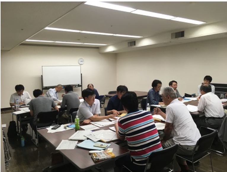
• 総監部門個別指導の様子