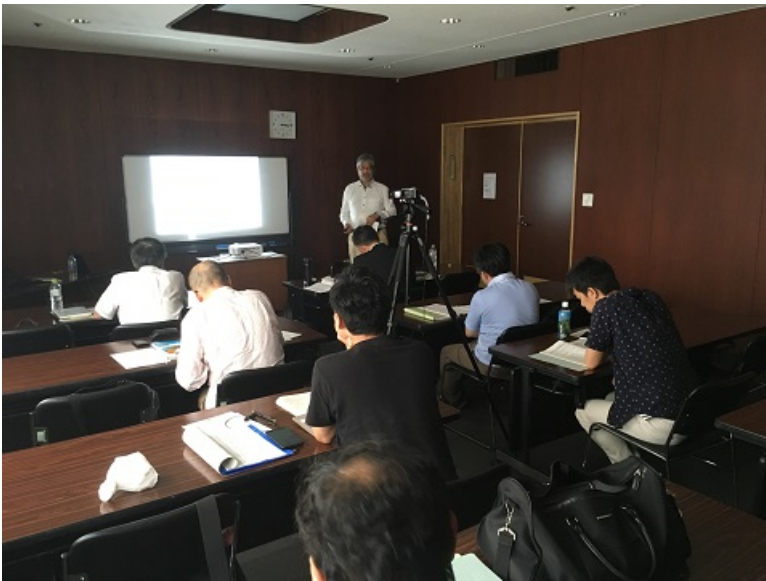
• 一般部門個別指導の様子