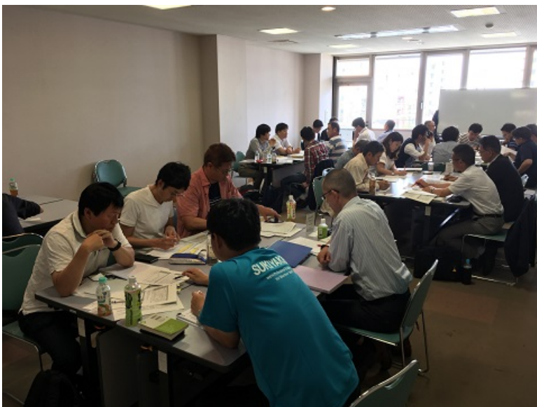
▽午後の、総監部門 APECさんによるセミナーの様子